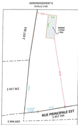
AGRANDISSEMENT B ECHELLE 1:500